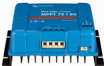
Contrôleur de charge solaire MPPT 75/50