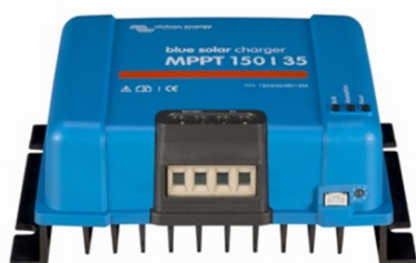
Contrôleur de charge solaire MPPT 150/35